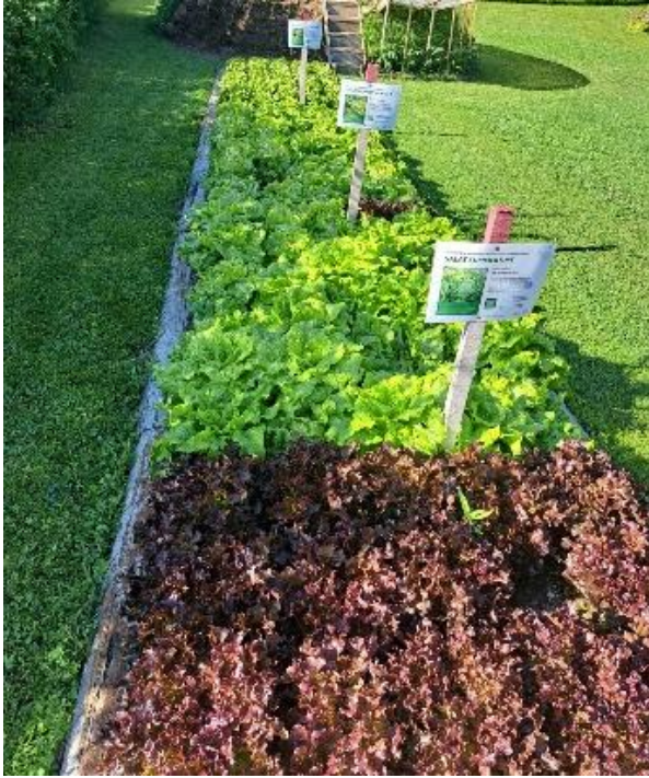
Anbauversuch mit Kopfsalaten im Jahr 2025