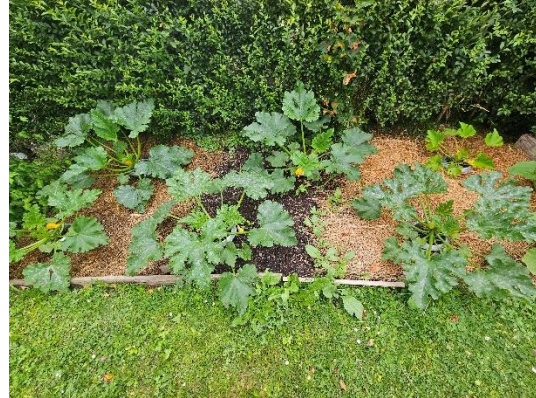
Mulchversuch mit Zucchini aus dem Jahr 2025