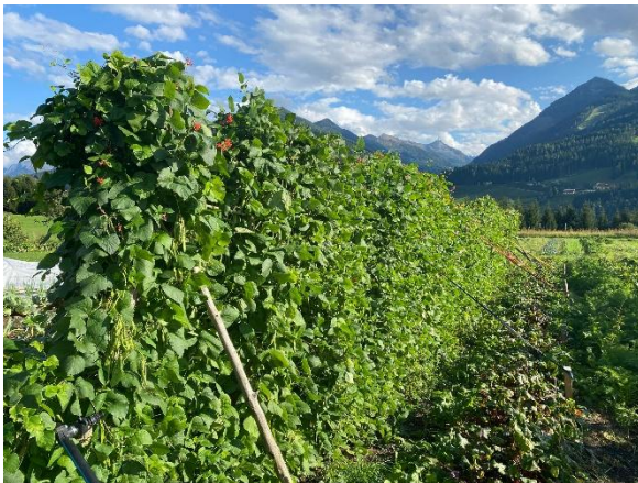
Anbauversuch mit der Steirischen Käferbohne im Jahr 2025